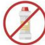
No limpies con amoníaco las pantallas táctiles de tu vehículo.