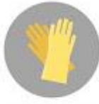
Guantes de látex desechables