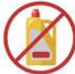
No utilices productos con lejía o agua oxigenada para el interior del coche.